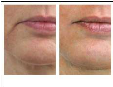
Pli d'amertume, raffermissment