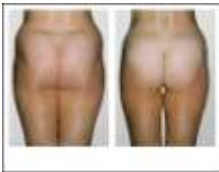
Cellulite Avant Après 14 séances

1er traitement approuvé par la FDA pour la réduction de la cellulite. Les Rolls LPG® agissent sur les 3 composantes de la cellulite: la rétention d'eau, la fibrose et l'hypertrophie des adipocytes.