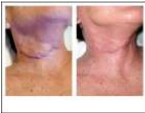
Cicatrices Avant Après 30 séances

Les techniques LPG® ont un impact positif sur l'intégrité du tissu conjonctif, elles traitent des zones difficiles d'accès, sans provoquer traumatisme et douleur, améliorent rapidement la vascularisation et le drainage, préviennent et / ou réduisent la fibrose. Les techniques LPG® stimulent également la production de collagène et d'élastine.